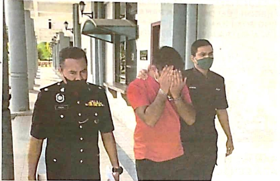
Suspek di bawa ke Mahkamah Majistret Sungai Petani, semalam.