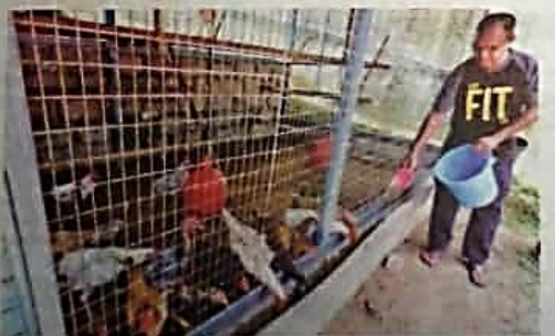
KERAJAAN menangguhkan kutipan fi permit ke atas jagung, soya, gandum dan komoditi proses berasaskan haiwan dan tumbuhan bagi tujuan penyediaan makanan ternakan.

"Jabatan Perkhidmatan Kuarantin dan Pemeriksaan Malaysia