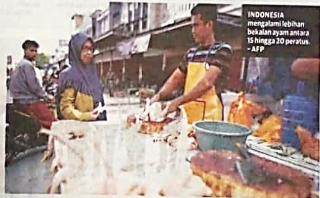
INDONESIA mengalami lebihan bekalan ayam antara 15 hingga 20 peratus.

"Kami berharap Singapura dapat membuat keputusan segera supaya kami tidak kehilangan momentum dalam pengeluaran bekalan ayam," ujarnya. - BERITAS