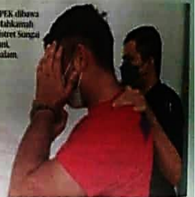
SUSPEK dibawa ke Mahkamah Majistret Sungai Petani, semalam.

Ahli keluarga mendakwa lelaki terbabit sebelum ini seorang pencinta kucing dan banyak memelihara haiwan terbabit di rumah.