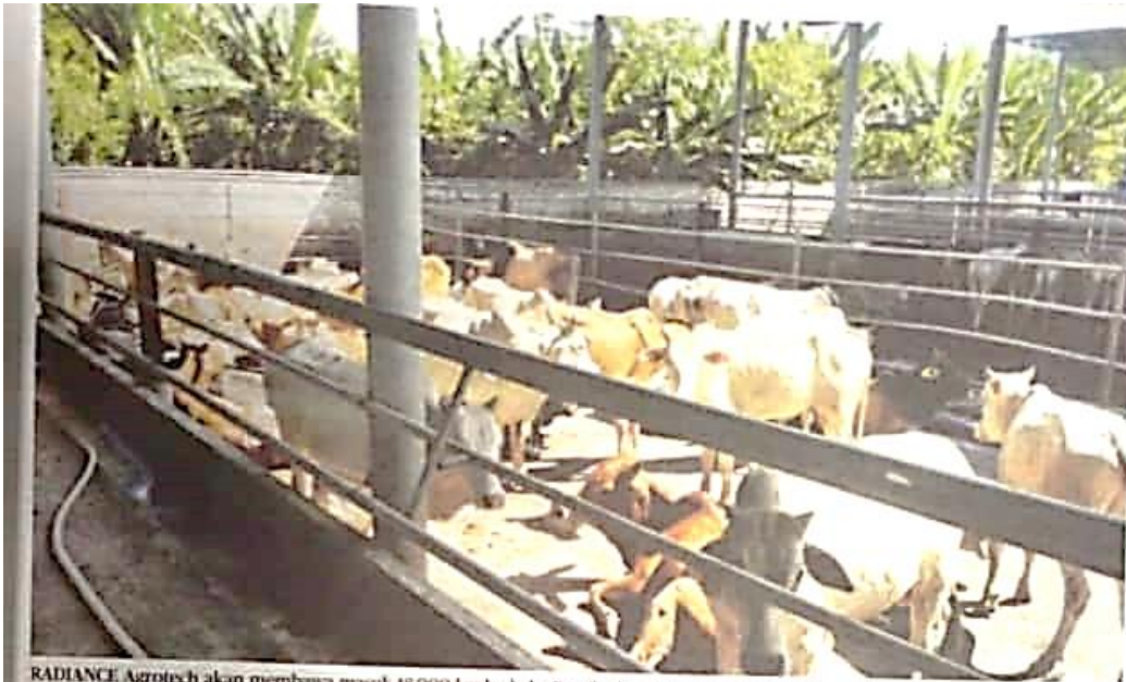
RADIANCE Agrotech akan membawa masuk 18,000 lembu baka Brazil sebagai permulaan pada tahun ini.