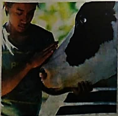
PENTERNAK kerugian 3.5 juta rupiah bagi setiap seekor lembu yang dijangkiti penyakit tersebut.