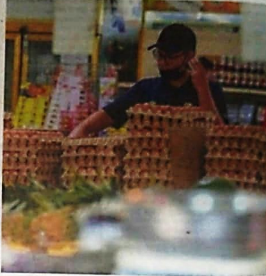
All in a day's work: A worker arranging bundles of eggs at the MyFarm Outlet Kashi in Putrajaya. Traders have been warned that the Ministry of Domestic Trade and Consumer Affairs will take action against profiteering.

"We are aware that some traders might take advantage of the situation by hoarding supplies, so we are constantly monitoring this. If members of the public come across this, please report to us," he said. On the removal of subsidies for bottled cooking oil after June 30, Nanta said the scheme was always supposed to be a temporary move. "The scheme which was implemented on Aug 1 last year was supposed to be for three months, but the government has continued it until today. "The government has spent up to RM20mil a month to provide the subsidies. Now, we have decided to remove it and allow the prices to be dictated by the market," he added. However, the subsidy for cooking oil sold in 1kg polybag packets will remain. The price of the packets is capped at RM2.50 per item. The maximum retail price imposed on bottled cooking oil was set at RM29.70 for a 5kg bottle, RM6.70 for 1kg, RM12.70 for 2kg and RM18.70 for 3kg.