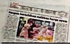
KERATAN Kosmo! 20 Jun 2022.